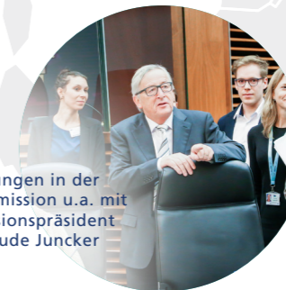
Begegnungen in der EU-Kommission u.a. mit Kommissionspräsident Jean-Claude Juncker

Bei Erwerb eines Zeugnisses gelten die normalen Bedingungen einer Universitätszugangsberechtigung oder einer vergleichbaren Qualifikation. Bei einem Teilnehmerzertifikat sind neben der Anwesenheitspflicht (mind. 80%) keine besonderen Vorkenntnisse notwendig. Die Bereitschaft, sich auf einen Dialog über geistige und spirituelle Inspirationsquellen der Europäischen Union einzulassen, gibt dem Lehrgang eine einzigartige Dynamik und wird von den TeilnehmerInnen erwartet. Aktive Teilnahme und Eigenengagement werden vorausgesetzt. Die Aufnahme erfolgt erst nach schriftl. Bestätigung der Projektleitung.