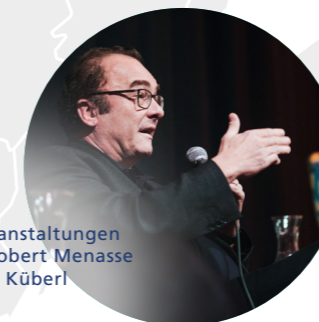
Dialogveranstaltungen u.a. mit Robert Menasse und Franz Küberl

Zusätzlich zum Abendlehrgang werden von der Akademie fakultativ zwei mehrtägige Studienreisen ins Ausland angeboten: Zu den europäischen Institutionen nach Brüssel, sowie in die Hauptstadt eines anderen EU-Landes.